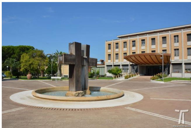
Col·legi Internacional del Caputxins, a Roma

I enmig de la festivitat de sant Francesc d'Assís no podíem deixar de preguntar al provincial dels caputxins de Catalunya i Balears com apropar la figura del sant a la societat. "L'experiència de sant Francesc comença un dia que ell decideix donar un petó a un leprós", recorda Rey, "així que penso que una manera d'acostar-se al sant Francesc més profund és detectar qui és el leprós que jo tinc a prop, aquell que jo estic evitant, aquell de qui jo no vull saber res, i acostar-m'hi".