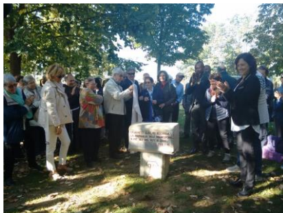
Aplec de Sant Francesc s'hi moria, Vic 8 d'octubre del 2017